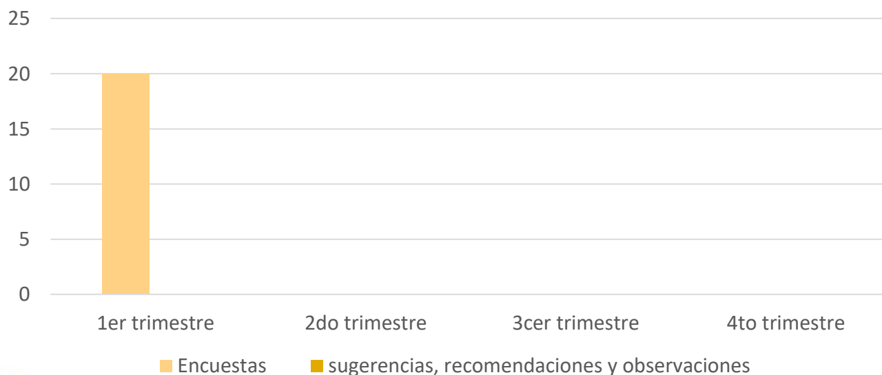
Encuestas aplicadas en la Tesorería Municipal

En relación a las 10 encuestas aplicadas de manera aleatoria en las instalaciones de la Tesorería Municipal, durante el periodo comprendido del 06 de enero al 22 de marzo del 2024 ; no se detectaron sugerencias, recomendaciones, no obstante se esta atento a cualquier comentario o sugerencia que se genere, para su inmediata respuesta.