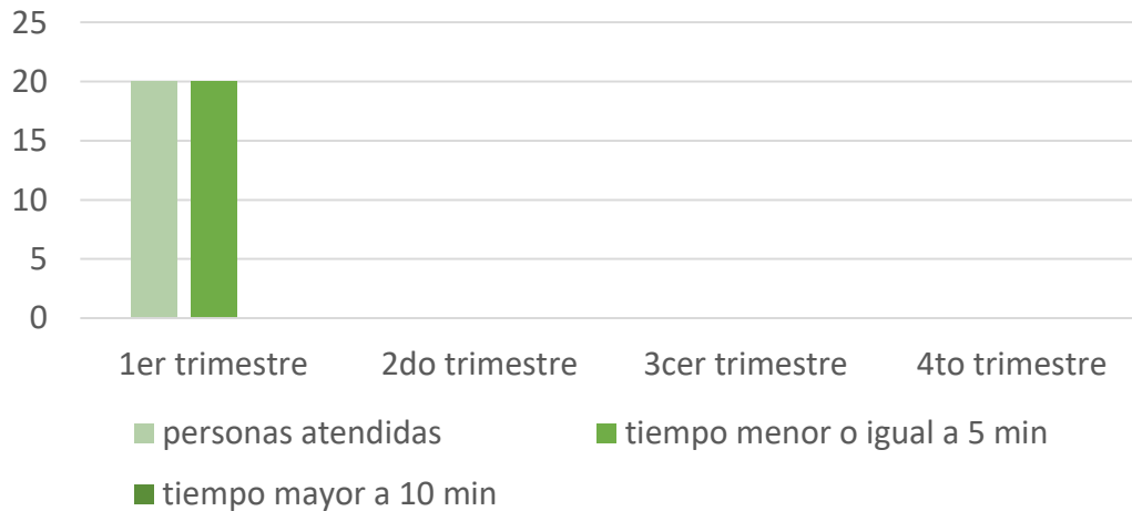
Tiempo de atención respecto al trámite de Expedición de Copia Certificada de Recibo Predial

De los 20 tramites evaluados de manera aleatoria en las instalaciones de la Tesorería Municipal, llevadas acabo de lunes a viernes, en el periodo Comprendido del 06 de enero al 22 de marzo del 2024 ; el 100% se realizaron en un promedio de 5 minutos; cumpliendo así con el compromiso.